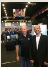
(Ci-dessus) La délégation en route pour la gloire. (Ci-contre) Christophe Riffaud avec le tondeur le plus célèbre du pays et sans doute du monde : Sir David Alexander Fagan, 5 fois champion du monde.