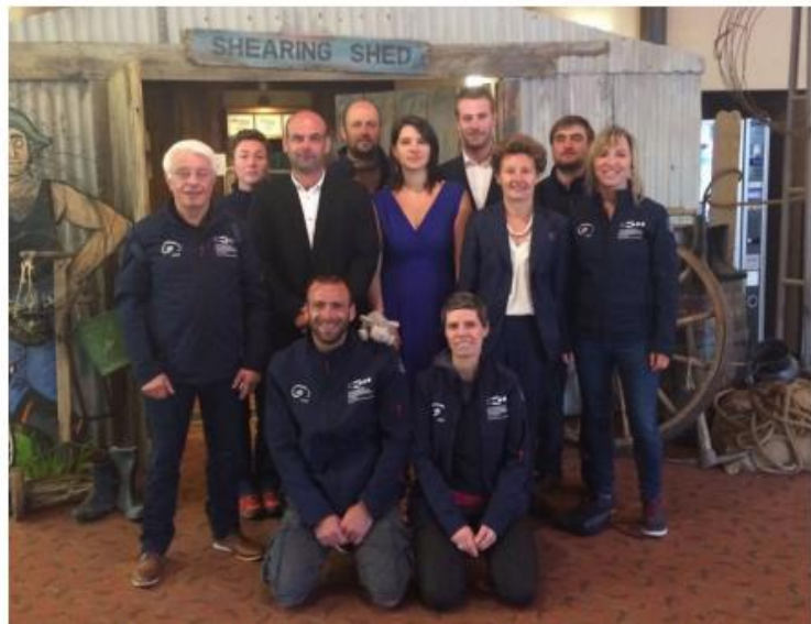
La délégation française qui a défendu le dossier de candidature devant le World Council à Invercargill en Nouvelle-Zélande. Avec eux sur la photo, portant un collier blanc, Florence Jeanblanc-Risler, ambassadeur de France en Nouvelle-Zélande.

Cette compétition, extrêmement populaire dans les pays anglo-saxons, n'a jamais eu lieu en France. La France sera ainsi le 9 e pays à l'accueillir après l'Angleterre, la Nouvelle-Zélande, l'Australie, le pays de Galles, l'Irlande, l'Afrique du Sud, l'Écosse