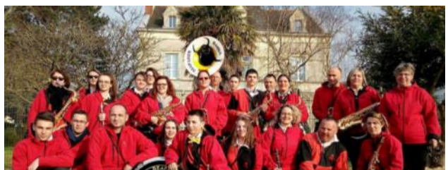
DIAPASON BANDA DE MAGNAC LAVAL

Diapason Banda a été créé en 1999 par une quinzaine d'amis musiciens avec l'aide de l'intercommunalité du canton de Magnac-Laval (Nord de la Haute-Vienne). Aujourd'hui, c'est la Communauté de Communes du Haut-Limousin en marche qui soutient l'association dans ses projets. Le siège social de cette association se trouve sur la commune de Magnac-Laval à 50 km au nord de Limoges. Après 20 ans d'existence, l'effectif s'est étoffé avec une trentaine de musiciens. Diapason banda anime Carnavals, Corsos fleuris, Marchés de Noël, Fêtes locales et participe également à des Festivals et Concerts tout au long de l'année. Cette Banda vous fera partager sa passion de la musique et sa convivialité à travers son répertoire varié et festif