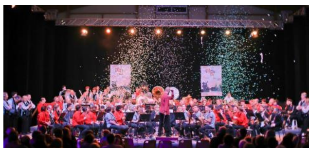
L'HARMONIE "LES ENFANTS DU DORAT"

Mélange d'influences diverses : Chanson trad' française, chanson réaliste, blues cajun, rock années 60 et 70 et quelques autres... Sur fond « électro-hargneux » : Edith Piaf ou Malicorne ce n'est pas incompatible avec Led Zepp ou Steppenwolf (Dans le même morceau de préférence !). Résultat d'une amitié de longue date entre des potes qui ont envie de faire tout ce qu'ils aiment.